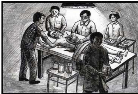
中共活体摘取法轮功学员器官模拟图

轮功以来，第一个以参与迫害者的身份，指证中共活体摘取法轮功学员器官真实存在的直接证人。对于参与者的无耻，他说：“我们的民警有不少就是变态的那种……对她进行属于是猥亵，她长的有点姿色，比较漂亮，对她进行强暴……”