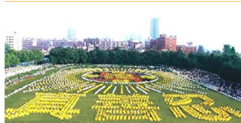
1997 年武汉 5000 多名法轮功学员排列法轮图形和“真善忍”字样。