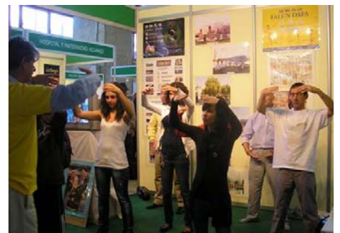
■ 参观者当场学炼法轮功功法

了寻找精神领域的东西而特地从卡里西亚赶来。她是在展会即将结束时拿到的传单,当时没有来得及看。回去后才看了传单,她说好象一种来自内心深处的震动,使她迫不及待地打电话,告诉学员:她要学法轮功,这就是她生命中长久以来一直在等待、在寻找的。她说,她看了传单后,回忆起当时经过拿到传单的展位时感受到一种非常祥和并且非常强大的能量。