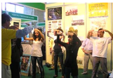
■ 参观者当场学炼法轮功

二零零九年十一月五日，西班牙最具知名度的全国健康博览会于首都马德里隆重开幕。展会期间，法轮大法学会共举办了三场介绍会，会后教