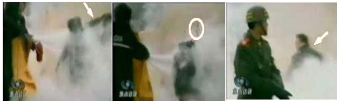
1.刘头部受重击 2.击打后飞出的重物 3.打击者仍保持用力姿势