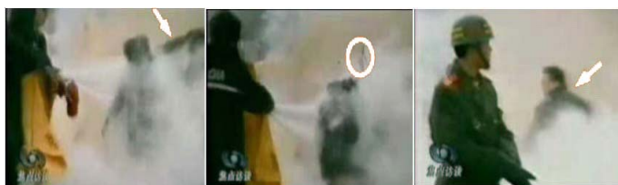
1.刘头部受重击 2.击打后飞出的重物 3.打击者仍保持用力姿势