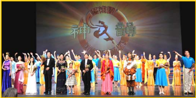
09 神韵世界巡演 三大艺术团 两大乐队现场伴奏 巡回 80 多个城市 300 场演出 观众将超过百万

在 2009 年的神韵晚会中，有表现天国庄严的《开创五千年文明》，还有表现邪不胜正的《金猴降妖》；有表现忠孝两全的《木兰从军》、还有表现佛法慈悲的《济公抢亲》……引领着观众穿越时空，追寻中华五千年历史与文化精髓，赞美着真善忍的普世价值，歌颂着崇高的信仰，传播着对神的敬仰和感恩。