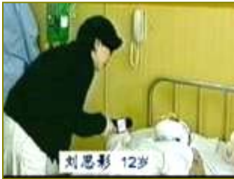
■ 气管切开还能说唱？ 无菌室里记者采访竟然不穿防护服没戴口罩。