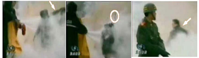
1.刘头部受重击 2.击打后飞出的重物 3.打击者仍保持用力姿势