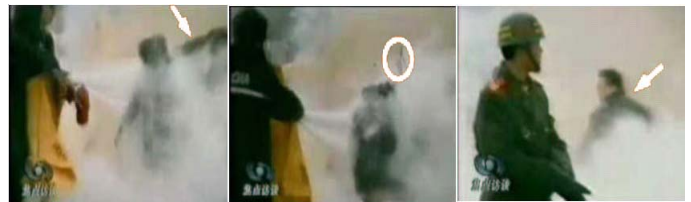
1.刘头部受重击 2.击打后飞出的重物 3.打击者仍保持用力姿势