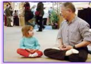
善良无罪，修炼无罪

在此善告信阳参与迫害者： 当你们与家人团聚时，是否想起因你们的迫害而不能与家人团聚的法轮功学员们，于心何安啊。自古以来，善恶有报、杀人偿命、欠债还钱是天理，人做了什么，都得去承担，那些“党叫干啥就干啥”，以“执行公务”，“执行命令”为由迫害法轮功学员的人，也许现在可以依赖中共政权的保护伞，暂时逃过正义的审判。可是中共垮台以后，每个人都将面对法律的制裁和正义的审判。那时上边的指示不会成为开脱自己罪行的依据。谁说了什么，谁做了什么，都抵赖不了。