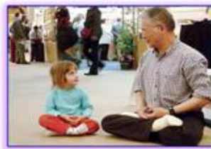
善良无罪，修炼无罪

在此善告信阳参与迫害者： 当你们与家人团聚时，是否想起因你们的迫害而不能与家人团聚的法轮功学员们，于心何安啊。自古以来，善恶有报、杀人偿命、欠债还钱是天理，人做了什么，都得去承担，那些“党叫干啥就干啥”，以“执行公务”，“执行命令”为由迫害法轮功学员的人，也许现在可以依赖中共政权的保护伞，暂时逃过正义的审判。可是中共垮台以后，每个人都将面对法律的制裁和正义的审判。那时上边的指示不会成为开脱自己罪行的依据。谁说了什么，谁做了什么，都抵赖不了。