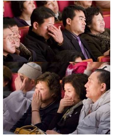
很多观众、包括性格坚忍的韩国男儿都被神韵感动得落泪

“一开始不太想来看神韵，因为介绍晚会朋友的面子，很勉强的来了，而且来晚了。没想到节目出乎意料的好。进到剧场时，就感到一种非常纯正的能量通遍全身，非常舒服、非常好！现在很后悔没看到前面的演出。在当今中国那个环境里，我对中国的那种神传