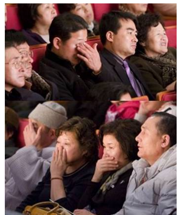
很多观众、包括性格坚忍的韩国男儿都被神韵感动得落泪

“一开始不太想来看神韵，因为介绍晚会朋友的面子，很勉强的来了，而且来晚了。没想到节目出乎意料的好。进到剧场时，就感到一种非常纯正的能量通遍全身，非常舒服、非常好！现在很后悔没看到前面的演出。在当今中国那个环境里，我对中国的那种神传