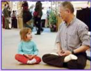
善良无罪，修炼无罪

十年来，众多的驻马店法轮功信仰者被劳教、被判刑、被迫害致死。被害人及家属撕心裂肺的哭喊！斑斑血泪令山河蒙尘，也令天地为之震怒！中共对法轮功学员的抓捕、关押、劳教和判刑，都没有任何的法律依据，遭到国际社会的强烈谴责。这么一件涉及上亿人信仰权利的大事，靠强权打压和政治欺骗还能维持多久呢？“历史上一切迫害正信的都没有成功过”。