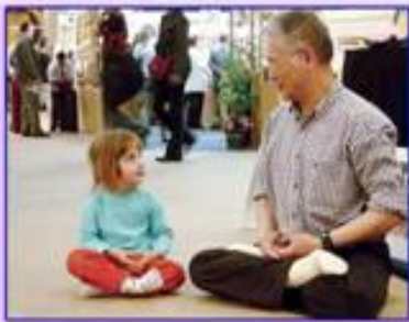
善良无罪，修炼无罪

十年来，众多的驻马店法轮功信仰者被劳教、被判刑、被迫害致死。被害人及家属撕心裂肺的哭喊！斑斑血泪令山河蒙尘，也令天地为之震怒！中共对法轮功学员的抓捕、关押、劳教和判刑，都没有任何的法律依据，遭到国际社会的强烈谴责。这么一件涉及上亿人信仰权利的大事，靠强权打压和政治欺骗还能维持多久呢？“历史上一切迫害正信的都没有成功过”。