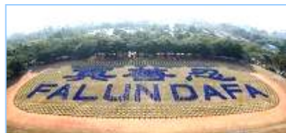
2008 年 12 月，近 3000 名法轮功学员在台湾炼功排字。

“前几年看了中央电视台报导的‘天安门自焚’事件后，非常震惊，海外各大媒体纷纷报导这一事件，没多久，国际教育发展组织发表了一份声明：‘天安门自焚’事件是中国政府一手导演的。当我详细看了‘自焚’事件的全部慢镜头后才明白，原来共产党竟然用这种杀人害命的方式迫害法轮功，欺骗老百姓，它还有什么坏事做不出来呢！特别是最近看到大纪元推出的《九评共产党》后才恍然大悟，真正看清了共产党的真正面目。虽然我已经十多年没有和党组织联系，没有交过党费，算是自动退党。但我感觉还是应该明确地严正声明一下，从自己内心彻底全面地清除共产党的毒素，退出这个邪恶的政党。”