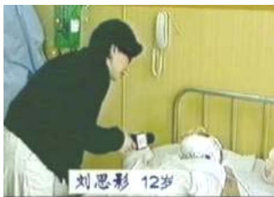
气管切开还能说、唱？记者采访不穿防护服，不戴口罩。

最简单的例子是，天安门广场上巡逻的警察从来没有背着灭火器巡逻的，但那一天有了；中央电视台的这个角度的摄像机也早就选好角度来拍摄这一“突发事件”了；在医院里，已经重度烧伤、被割开喉咙的小女孩却能吐字清晰的说话唱歌，创下医学奇迹；自称是法轮功学员的“王进东”自焚时衣服已被烧焦，但其腿间盛满汽油的塑料瓶却完好无损；在他喊完口号之前，警察手中的灭火毯停在镜头前悠闲的摇晃很久，没有丝