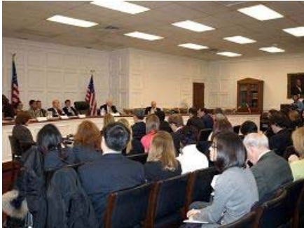
听证会现场座无虚席，这是美国新政府上任以来，关于中国人权问题的第一次听证。

联合国人权理事会将于二零零九年二月九日对中共统治下的中国人权状况进行全面审查。美国众议院人权委员会也于上周专门就此议题举行听证。这也是奥巴马上任后美国国会首次中国人权听证。