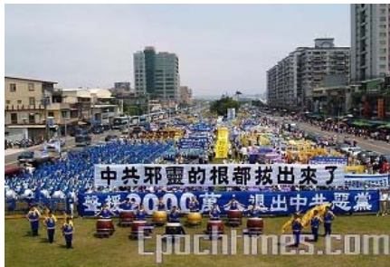
2007年4月，台湾民众声援2千万勇士退出中共（大纪元）

据全球退党服务中心负责人李大勇博士介绍，这个新服务项目是应广大民众的需求而新增的。