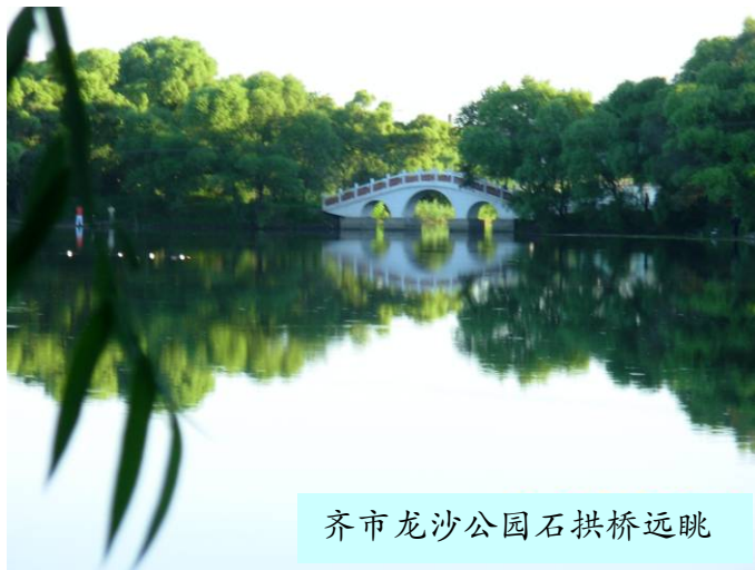
齐市龙沙公园石拱桥远眺