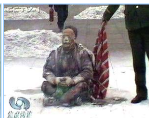
1. 气管切开还能说唱 2. 装汽油的雪碧瓶完好无损