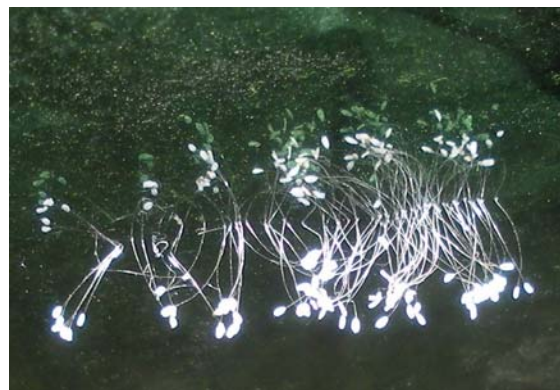
(此图是盛开在玻璃上的优昙婆罗花)

然而，在我们黄石各地有在玻璃上盛开的优昙婆罗花，还有在辣淑上，石头上等处盛开的优昙婆罗花。