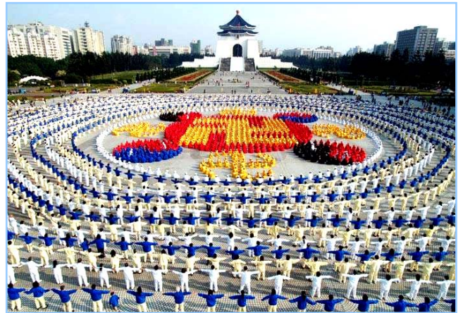
■ 2005 年 12 月 25 日，台湾 4000 多名法轮功学员集体炼功，排组法轮图形。

老干部对法轮功进行了数月的详细调查，得出“法轮功于国于民有百利而无一害”的结论，并于年底向中共中央政治局提交了调查报告。