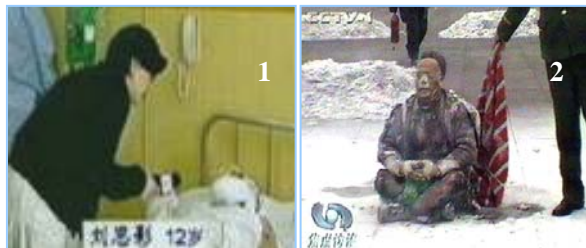
1. 气管切开还能说唱 2. 装汽油的雪碧瓶完好无损

中央电视台此次自焚只是报应的一个前兆。为中共邪党充当喉舌骗人害人的所谓“新闻工作者”们应该好好反省，停止对法轮功和无辜民众的造谣构陷，退出中共邪党，选择一条自新之路。