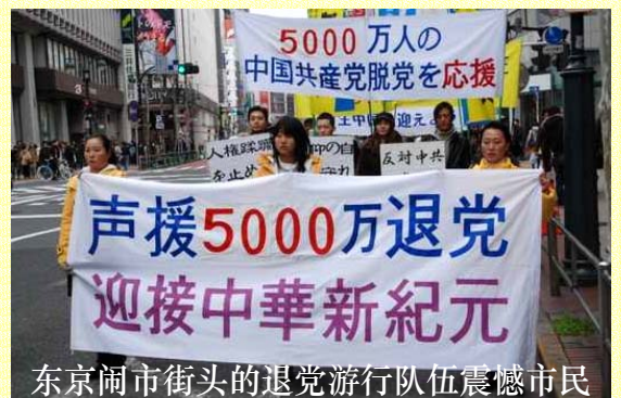
东京闹市街头的退党游行队伍震撼市民

图片新闻：3月1日下午在日本东京涉谷区繁华市中心，来自日本首都约350位议员、人权组织代表及民众参与了由全球退党服务中心等多个团体举办的声援5千万中国民众退出中共的集会游行活动。