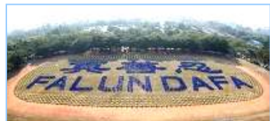
二零零八年十二月，近三千名法轮功学员在台湾炼功排字。

“前几年看了中央电视台报导的‘天安门自焚’事件后，非常震惊，海外各大媒体纷纷报导这一事件，没多久，国际教育发展组织发表了一份声明：‘天安门自焚’事件是中国政府一手导演的。当我详细看了‘自焚’事件的全部慢镜头后才明白，原来共产党竟然用这种杀人害命的方式迫害法轮功，欺骗老百姓，它还有什么坏事做不出来呢！特别是最近看到大纪元推出的《九评共产党》后才恍然大悟，真正看清了共产党的真正面目。虽然我已经十多年没有和党组织联系，没有交过党费，算是自动退党。但我感觉还是应该明确的严正声明一下，从自己内心彻底全面的清除共产党的毒素，退出这个邪恶的政党。”