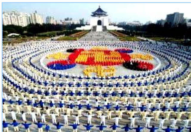
■ 2005年12月25日，台湾4000多名法轮功学员集体炼功，排组法轮图形。