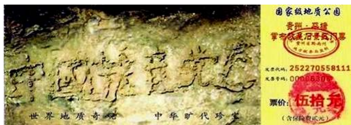
图为藏字石风景区门票:“中国共产党亡”清晰可见

队)了,那能是你说了算的吗?它通过那种形式已经把你控制住了,它不认可呀,这个邪灵不认可,你不还是它的一个成员,一粒子吗?你要脱离它,也得要有一定的反过来的形式,公开声明退党(团、队)。