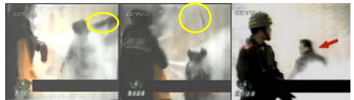
1. 击打者的手臂 2. 击打后飞出的重物 3. 击打者仍保持用力姿势