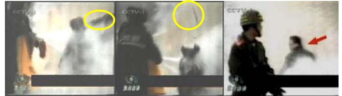
1. 击打者的手臂 2. 击打后飞出的重物 3. 击打者仍保持用力姿势