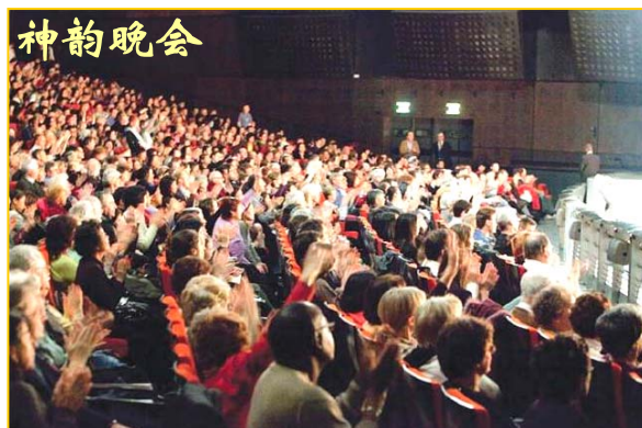
2009年3月1日，神韵艺术团在巴黎最后一场谢幕时，观众依依不舍挥手致意。

神韵纽约艺术团到访艺术之都巴黎，从2月27日至3月1日，连续四场演出给极具艺术鉴赏力的巴黎人带来美不胜收的中国古典舞、音乐、声乐等艺术，并以此诠释博大精深的中华神传文化。深受震撼的观众们演出后纷纷表达了他们对神韵艺术的赞美。