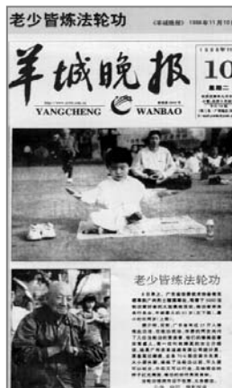
■中共迫害前大陆媒体的公正报道——《老少皆炼法轮功》

法轮功以真、善、忍为修炼原则，包括五套缓慢优美的功法动作，使修炼者身心健康，并能达到开智开慧。