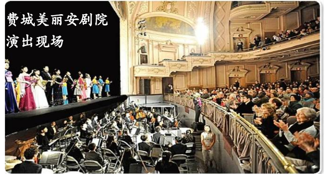
费城美丽安剧院 演出现场

由修炼法轮功的艺术家组成的神韵纽约艺术团、神韵国际艺术团和神韵巡回艺术团，2008 年 12 月 19 日兵分三路，同时在美国费城、亚特兰大和迈阿密拉开了 2009 年全球巡演的序幕。预计今年的神韵晚会将巡回世界四大洲 80 个城市，演出约 300 场，刷新去年 215 场的纪录。