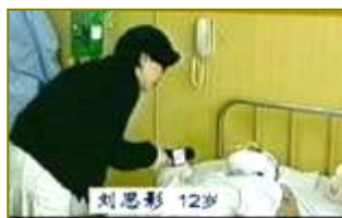
■ 气管切开还能说唱？无菌室里记者采访竟然不穿防护服没戴口罩。