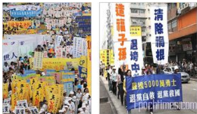
生命觉醒大潮波澜壮阔

二零零四年十一月发表在大纪元网站的系列社论《九评共产党》，以强有力的历史事实揭示了中共本质，在华人世界引发了一场精神觉醒运动，形成声势浩大的退出中共及其相关组织的大潮。