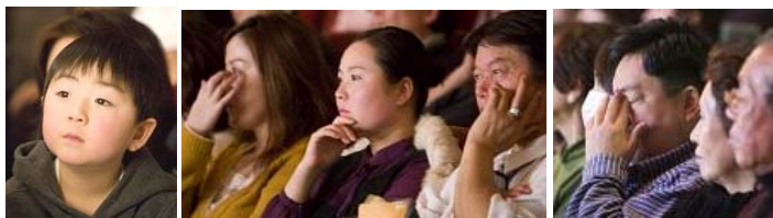
■神韵晚会华美灵动，内涵悠远，深深触动日本观众。

他静静而专心地听着，我说：“缘深缘浅可全凭自己的心哪，你有心要看，那我今天就送你一盘神韵晚会，让你好梦成真！”于是我从随身带的包中取出一盘赠送给他。他珍惜地接过晚会光盘，看的出，他满心的欢喜和自足，连声说：“谢谢！神韵真好！今天我也接上神韵缘啦！”