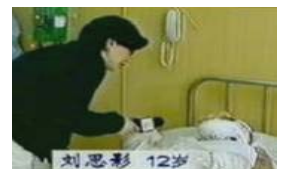
气管切开后能讲话