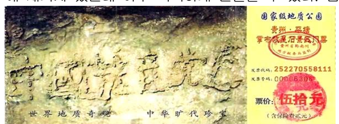
귀주성 평당현 장포향 풍경구 문표

2002년 6월, 귀주성 평당현 장포향의 한 촌민이 장포풍경구에서 하나의 거석을 발견하였다. 돌의 표면에는 여섯 개의 큰 글자 <중국공산당망>이 가쁜하게 배열되어 있다. 세 갈래 전문가들이 현지에 와 고찰한데 의하면 이 거석은 오늘까지 이미 2억 7천만년이 되었으며 500년 전에 높은 곳에서 떨어져 내려와 두 조각으로 갈라졌다고 한다. 글자는 오른쪽의 거석에 새겨져 있는데 아주 똑똑하게 분별할 수 있다. 검