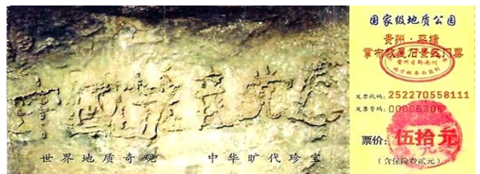
귀주성 평당현 장포향 풍경구 문표

2002년 6월, 귀주성 평당현 장포향의 한 촌민이 장포풍경구에서 하나의 거석을 발견하였다. 돌의 표면에는 여섯 개의 큰 글자 <중국공산당망>이 가쁜하게 배열되어 있다. 세 갈래 전문가들이 현지에 와 고찰한데 의하면 이 거석은 오늘까지 이미 2억 7천만년이 되었으며 500년 전에 높은 곳에서 떨어져 내려와 두 조각으로 갈라졌다고 한다. 글자는 오른쪽의 거석에 새겨져 있는데 아주 똑똑하게 분별할 수 있다. 검