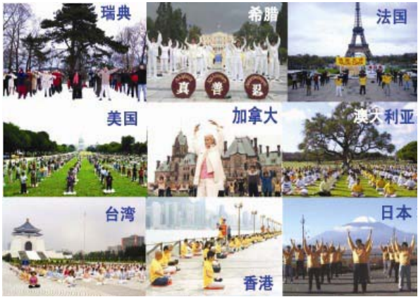
图：不同族裔的法轮功 修炼者在炼功

● 洪传世界 法轮功已洪传世界 80 多个国家和地区，受到世界人民的爱戴和尊敬。因李洪志先生和法轮大法对人类身心健康作出的杰出贡献，获得各国政府褒奖、支持议案信函超过 2977 项。法轮功书籍被译成 40 多种语言全球发行。