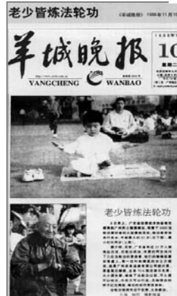
■中共迫害前大陆媒体的公正报道——《老少皆炼法轮功》

法轮功以真、善、忍为修炼原则，包括五套缓慢优美的功法动作，使修炼者身心健康，并能达到开智开慧。