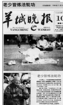
■中共迫害前大陆媒体的公正报道——《老少皆炼法轮功》

法轮功以真、善、忍为修炼原则，包括五套缓慢优美的功法动作，使修炼者身心健康，并能达到开智开慧。