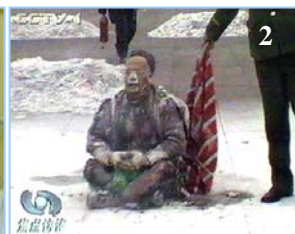
1. 气管切开还能说唱 2. 装汽油的雪碧瓶完好无损