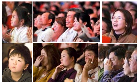
■ 神韵晚会华美灵动，内涵悠远，深深触动韩国（上图）和日本（下图）观众。

韩国十四位国会议员及大邱、首尔两大城市的多位市长、律师及艺术界、文化界等知名人士纷纷为神韵艺术团发表贺辞，盛赞神韵晚会是世界一流演出。日本前首相海部俊树等多位国会议员及各界名人纷纷致辞，赞赏神韵演出世界一流，并祝贺演出圆满成功。