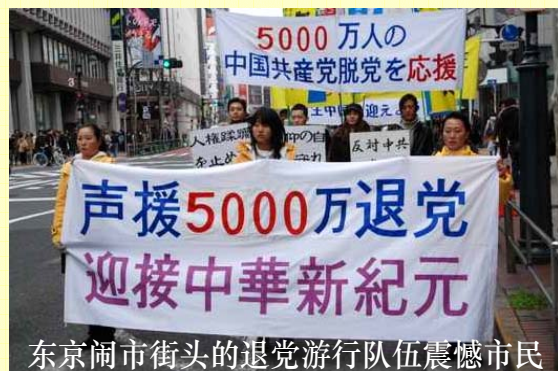
东京闹市街头的退党游行队伍震撼市民

图片新闻：3月1日下午在日本东京涉谷区繁华市中心，来自日本首都约350位议员、人权组织代表及民众参与了由全球退党服务中心等多个团体举办的声援5千万中国民众退出中共的集会游行活动。