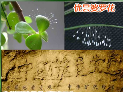
世界地质奇观 中华旷代珍宝 贵州平塘县的“藏字石”