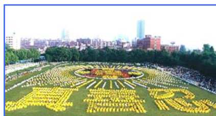
▲ 5000 多名武汉法轮功学员集体炼功，排组法轮图形和“真善忍”。(1997) 右图：老少皆炼法轮功(《羊城晚报》1998.11.10)

● 法轮大法至今已洪传世界 80 多个国家和地区，获得各国政府褒奖、支持议案、信函超过 2977 项。法轮大法的主要著作《转法轮》已被译成 30 多种文字，在全世界出版发行。