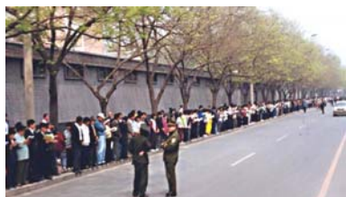
法轮功学员文明安静，警察不用维持秩序，在一旁聊天。学员背后不是中南海红墙，所谓的“围攻中南海”根本不存在。

4·25 当晚，江泽民出于妒忌，强行推翻政府总理的公开决定，把和平上访歪曲成“围攻中南海”，并于 1999 年 7 月开始全面迫害法轮功。◇