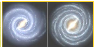
左图：银河系的目前结构