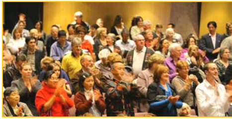
■ 澳洲观众向神韵精彩的演出鼓掌致谢