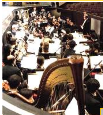
中西合璧神韵艺术团 乐队奏出旷世天音

■ 神韵艺术团乐队以西洋管弦乐器为基础，加上传统中国乐器如二胡、琵琶、古筝、笛子等，使演奏的乐曲既发挥西洋管弦乐潜能，又富中国民族特色。