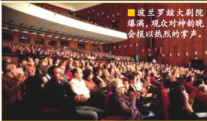
■波兰罗兹大剧院爆满，观众对神韵晚会报以热烈的掌声。