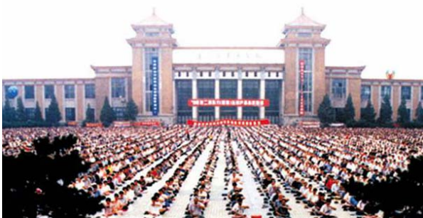
历史图片：九八年沈阳万人大型集体炼法轮功

母亲因为治好了病，同时出于对“真善忍”道义的信奉更加积极修炼了，还推荐让久病的父亲、有胃病、牙病的姐姐以及身边的亲朋好友修炼，母亲就是让更多的人能够祛病健身、让他们做好人。凡是听从母亲的话进行修炼的人都收到了很好的效果，而且为人处事的方式也得到了很好的改善，对人更加真诚宽容了，他们都非常尊重母亲。