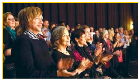
▲ 意犹未尽的挪威观众。▶ 3月25日,台湾的39场神韵演出圆满落幕。民进党主席蔡英文致花篮祝贺。