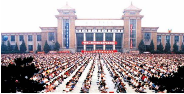
历史图片：九八年沈阳万人大型集体炼法轮功

母亲因为治好了病，同时出于对“真善忍”道义的信奉更加积极修炼了，还推荐让久病的父亲、有胃病、牙病的姐姐以及身边的亲朋好友修炼，母亲就是让更多的人能够祛病健身、让他们做好人。凡是听从母亲的话进行修炼的人都收到了很好的效果，而且为人处事的方式也得到了很好的改善，对人更加真诚宽容了，他们都非常尊重母亲。