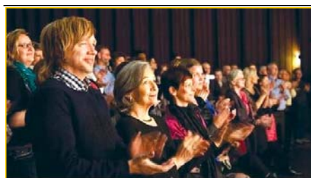
▲ 意犹未尽的挪威观众。▶ 3月25日,台湾的39场神韵演出圆满落幕。民进党主席蔡英文致花篮祝贺。