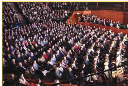
▲ 瑞典斯德哥尔摩 Cirkus 大剧场爆满。▶ 澳洲堪培拉观众为神韵倾倒。