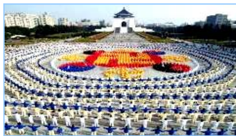
2005年12月25日，台湾4000多名法轮功学员集体炼功，排组法轮图形。

● 洪传世界 法轮功已洪传世界80多个国家和地区，受到世界人民的爱戴和尊敬；给中国赢得巨大的国际声誉。李洪志先生和法轮大法对人类身心健康作出的杰出贡献，获得各国政府褒奖、支持议案信函超过2977项。自2000年起，李洪志先生连续四年被提名诺贝尔和平奖。