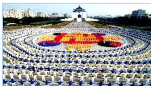
2005年12月25日，台湾4000多名法轮功学员集体炼功，排组法轮图形。

● 洪传世界 法轮功已洪传世界80多个国家和地区，受到世界人民的爱戴和尊敬；给中国赢得巨大的国际声誉。李洪志先生和法轮大法对人类身心健康作出的杰出贡献，获得各国政府褒奖、支持议案信函超过2977项。自2000年起，李洪志先生连续四年被提名诺贝尔和平奖。