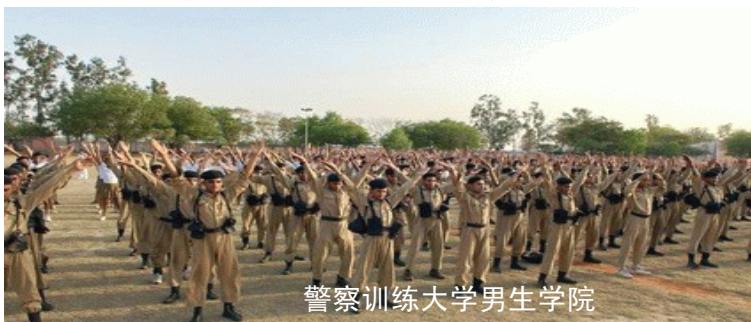
警察训练大学男生学院

同日，学员们在尼卢公园炼功，随后到市政厅演出。晚上，天国乐团受邀来到另一处新开的露天特产市集 DILLI HAAT，在一个大型主舞台上演奏。◇