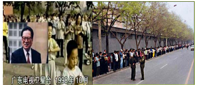
广东电视卫星台 1998年10月

可是，1999年4月何祚庥在天津一全国性期刊上再次诬蔑法轮功，造成了很坏的影响。象以往一样，学员本着善意自发的去跟编辑们反映真实情况。编辑部的领导出面表示愿意更正这一不实文章，但第二天却突然改口，拒绝更正。甚至调来警察粗暴殴打，45位学员被抓。天津市政府的官员还告诉上访学员，要说明情况就要找北京的中央政府。反常态度和警察的毫无顾忌使人们明显感到一股来自中央高层的压力。