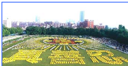
▲ 5000 多名武汉法轮功学员集体炼功，排组法轮图形和“真善忍”。(1997) 右图：老少皆炼法轮功

● 法轮大法至今已洪传世界 80 多个国家和地区，获得各国政府褒奖、支持议案、信函超过 2977 项。法轮大法的主要著作《转法轮》已被译成 30 多种文字，在全世界出版发行。