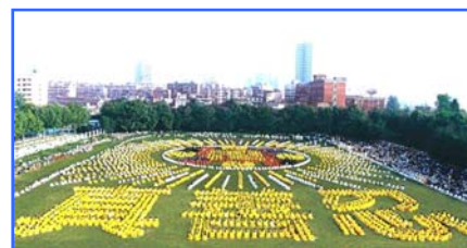
▲ 5000 多名武汉法轮功学员集体炼功，排组法轮图形和“真善忍”。(1997) 右图：老少皆炼法轮功(《羊城晚报》1998.11.10)

● 法轮大法至今已洪传世界 80 多个国家和地区，获得各国政府褒奖、支持议案、信函超过 2977 项。法轮大法的主要著作《转法轮》已被译成 30 多种文字，在全世界出版发行。