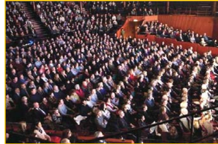
▲ 瑞典斯德哥尔摩 Cirkus 大剧场爆满。▶ 澳洲堪培拉观众为神韵倾倒。