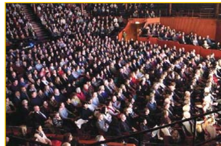
▲ 瑞典斯德哥尔摩 Cirkus 大剧场爆满。▶ 澳洲堪培拉观众为神韵倾倒。