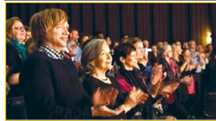
▲ 意犹未尽的挪威观众。▶ 3月25日,台湾的39场神韵演出圆满落幕。民进党主席蔡英文致花篮祝贺。