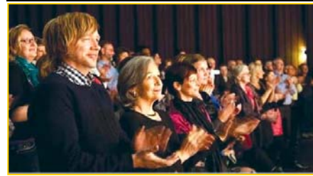
▲ 意犹未尽的挪威观众。▶ 3月25日,台湾的39场神韵演出圆满落幕。民进党主席蔡英文致花篮祝贺。