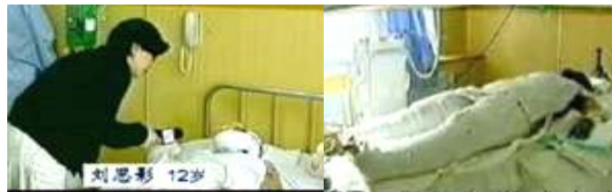
气管切开还能说唱？记者 央视《焦点访谈》中的“自采访不穿防护服不戴口罩。焚者”被包裹得严密。

* 医疗常识告诉我们，烧伤部位不能用绷带包扎，应尽量让皮肤裸露在空气中。但央视中的“自焚者”全身包裹严实，躺在病床上。