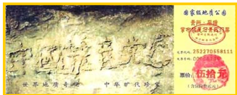
左图： 贵州平塘县 掌布风景区 门票

一提到“天灭中共、三退保命”，有的朋友就说这是“搞政治”。但如果要查查“天灭中共”这个说法的来源，却发现居然是上天点拨石头“实话石说”。“藏字石”位于贵州省平塘县掌布风景区内，专家鉴定为500年前一块2亿7千万年的巨石从崖壁落下，落地一分为二。2002年6月裂开的石头断面被当地人发现有一行汉字，这些汉字经第三批国内专家鉴定，其结论为天然形成。而石头上清晰可见的六个字是：中国共产党亡（国内媒体隐去了亡字）。老天爷难道在“搞政治”吗？