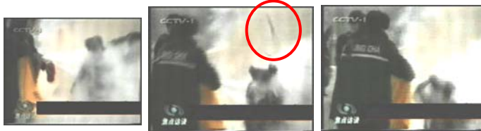
1、刘春玲头部 2、击打后飞出的重物 3、手摸被打后的头部

如果把中央电视台《焦点访谈》提供的录像镜头放慢可以看见，被官方媒体称为自焚而死的刘春玲身上的火焰已经基本熄灭，突然，有人用物体猛击她的头部，刘春玲随即倒地，一条状物快速弹起，从死者脑后飞出，又以极快的速度从空中落下。