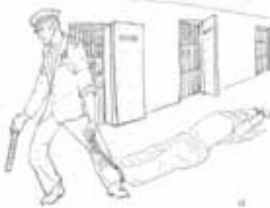
用绳拖着在地上滚