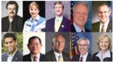
■丹麦、美国乔治亚州、俄州政要3月致贺信祝神韵演出成功。