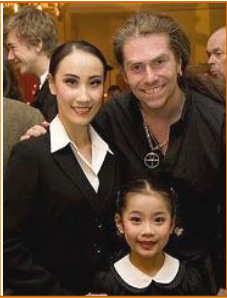
■中图：台湾观众为神韵喝彩。右图：瑞典各政党议员、知名艺术家3月向光临本地的神韵艺术团致贺，图为对神韵倍加赞赏的瑞典音乐家马格努斯·若森与神韵演员合影。