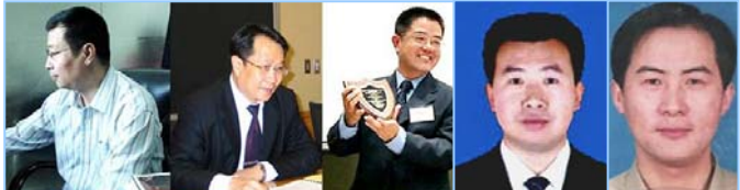
国内部分为法轮功学员无罪辩护的律师（左起）：

不解决，中国的其它社会问题不可能解决。九年打压法轮功，耗费了纳税人的巨额财富，众多人家妻离子散、家破人亡、天怒人怨。