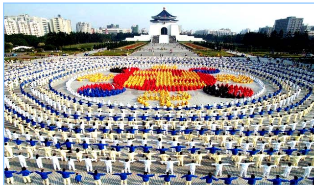
■ 2005 年 12 月 25 日，台湾 4000 多名法轮功学员集体炼功，排组法轮图形。

● 洪传世界 法轮功迄今已洪传世界 80 多个国家和地区，受到世界人民的爱戴和尊敬。因李洪志先生和法轮大法对人类身心健康作出的杰出贡献，已获得各国政府褒奖、支持议案信函超过 2977 项。法轮功书籍被译成 30 多种语言。自 2000 年起，李洪志先生连续四年被提名诺贝尔和平奖。