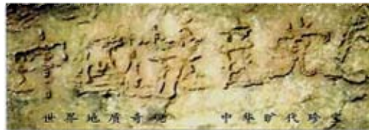
字乡塘 石的县贵 『。』掌州 藏布平

其牺牲品，只有声明退出中共的组织才能废除毒誓，才能在大劫难中保住性命，世界各国有很多古老而著名的预言都提到了当今正在发生的事:2002年6月贵州平塘县掌布乡发现了2亿7千万年前的藏字石，巨石断面上天然形成六个大字：中国共产党亡(下图)。所以，善待法轮大法，认清中共，退出中共党、团、队，会给自己开创美好的未来。在真相大显之前，每个人还有机会选择自己的未来。