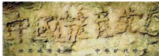
字乡塘 石的县贵 『。』掌州 藏布平

其牺牲品，只有声明退出中共的组织才能废除毒誓，才能在大劫难中保住性命，世界各国有很多古老而著名的预言都提到了当今正在发生的事:2002年6月贵州平塘县掌布乡发现了2亿7千万年前的藏字石，巨石断面上天然形成六个大字：中国共产党亡(下图)。所以，善待法轮大法，认清中共，退出中共党、团、队，会给自己开创美好的未来。在真相大显之前，每个人还有机会选择自己的未来。