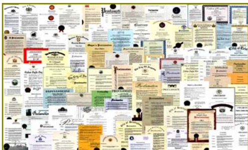
■法轮大法获各国政府褒奖、支持议案信函 2977 项(至 2009 年 3 月)。

在这些现象的背后有没有深层的原因？有心人会发现许多问题，如：手无寸铁的法轮功为什么能抵挡住中共不