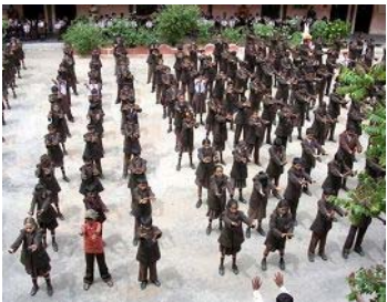
집체련공하고있는 JYOTHI SCHOOL 학교학생들