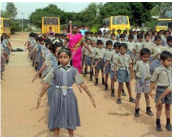
집체련공하고있는 VIDYA JYOTHI SCHOOL 사생들