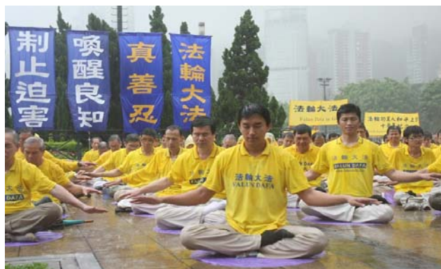
磐石， 在滂沱大雨中炼功 数百名法轮功学员坚如

尽管早上大雨滂沱，雷声屡作，数百名来自台湾、日本、新加坡等地的法轮功学员不为所动，在维园南亭排列整齐的炼功。