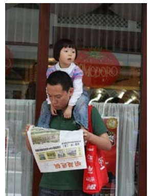
了解真相得救度，行人 在看《明慧周报》

从台湾专程来港参加今次活动的人权法律协会亚洲执行长朱婉琪表示，感谢当年上访的法轮功学员将希望带给全世界。她说：“由于你们的上访，让我们看到中共窃据中国大陆这些年来的中国的和平希望；由于你们的道德勇气，让全世界几乎是丧失信心的人，重新看到这样子的伟大的高德大法在中国大陆的洪传；你们是中国希望。”