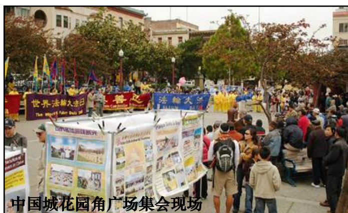
中国城花园角广场集会现场