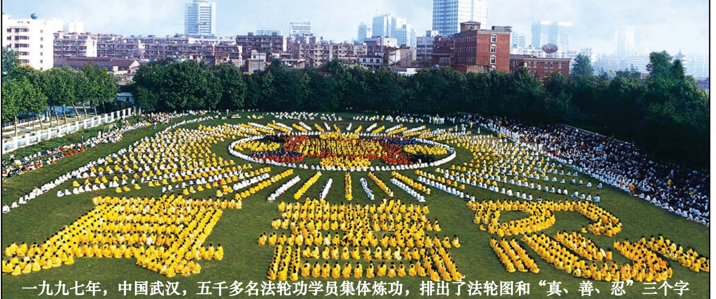
一九九七年，中国武汉，五千多名法轮功学员集体炼功，排出了法轮图和“真、善、忍”三个字

从地球北极边缘的格陵兰岛到接近南极的新西兰南岛，从气候寒冷的北欧到赤日炎炎的非洲，从喜马拉雅山麓到日月潭边，从莱茵河畔到自由女神像前，从国会山庄到万国宫前……，都可听到法轮大法悠扬宁静的炼功音乐，都可见到祥和徐缓的炼功场面。根据对在明慧网发表的各地法轮大法活动报道、心得交流和弟子向李洪志师父发来的节日问候的不完全统计，法轮大法已传至亚洲的三十二个国家和地区、美洲的二十一个国家、欧洲的四十六个国家、大洋洲的三个国家和非洲的十二个国家。这表明中共对法轮功的迫害已彻底失败，法轮功经历长达十年的连宵风雨仍屹然挺立。