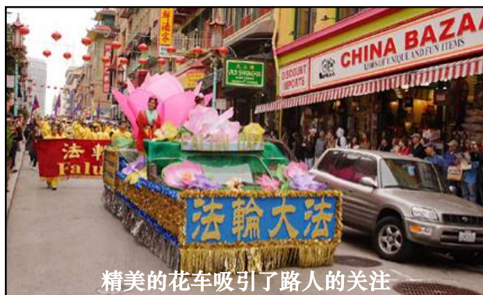
精美的花车吸引了路人的关注