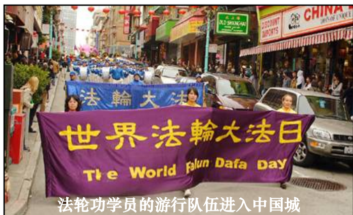
法轮功学员的游行队伍进入中国城

二零零九年五月十三日是第十届世界法轮大法日，美国旧金山法轮功学员五月二十三日在旧金山市中心游行，并在中国城花园角广场举行庆祝活动，表达对师父慈悲救度的感恩，展示法轮大法的美好。