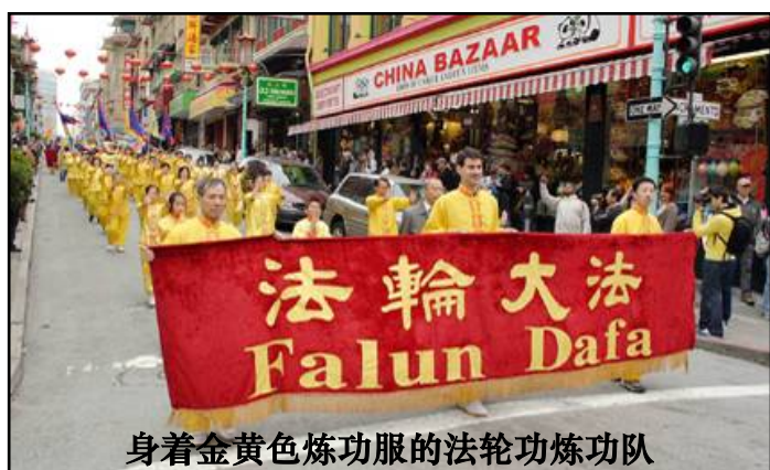
身着金黄色炼功服的法轮功炼功队